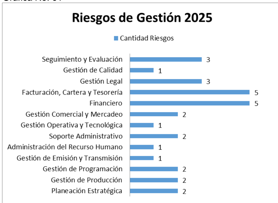
Gráfica No. 01